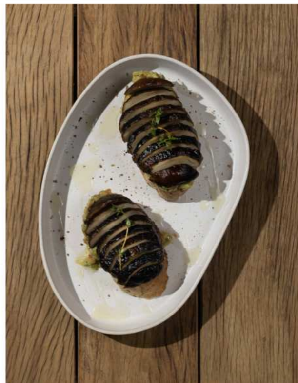
50. MUSHROOM AVOCADO TOAST แซนด์วิชเห็ดอโวกาโด 290.-