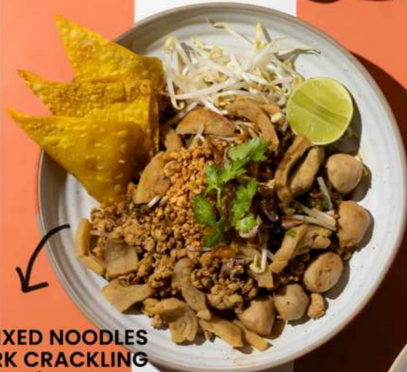
24. SPICY MIXED NOODLES WITH PORK CRACKLING ก๋วยเตี๋ยวลูกกากหมู 250.-