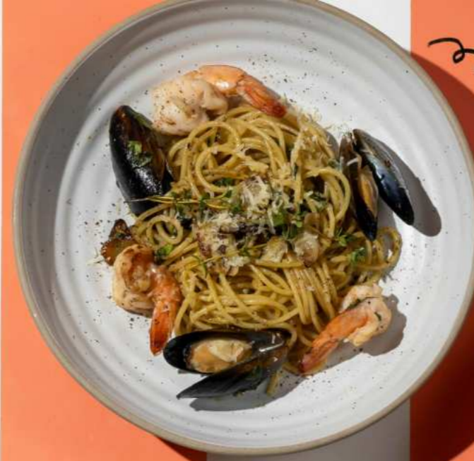
27. GARLIC BUTTER SEAFOOD PASTA พาสต้าซิวัดการ์ลิคบัตเตอร์ 380.-