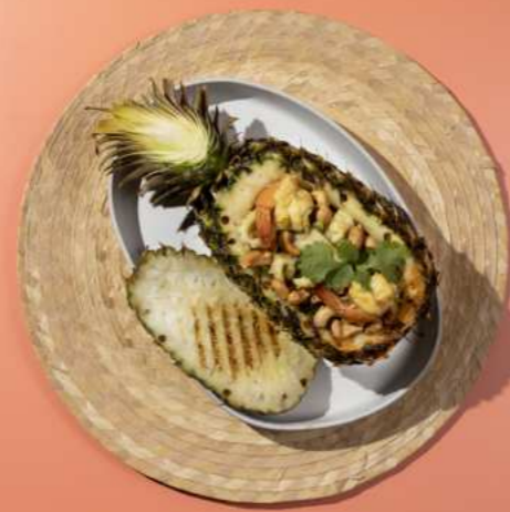
35 . PINEAPPLE FRIED RICE WITH SEAFOOD ข้าวผัดสับปะรดทะเล 350.-