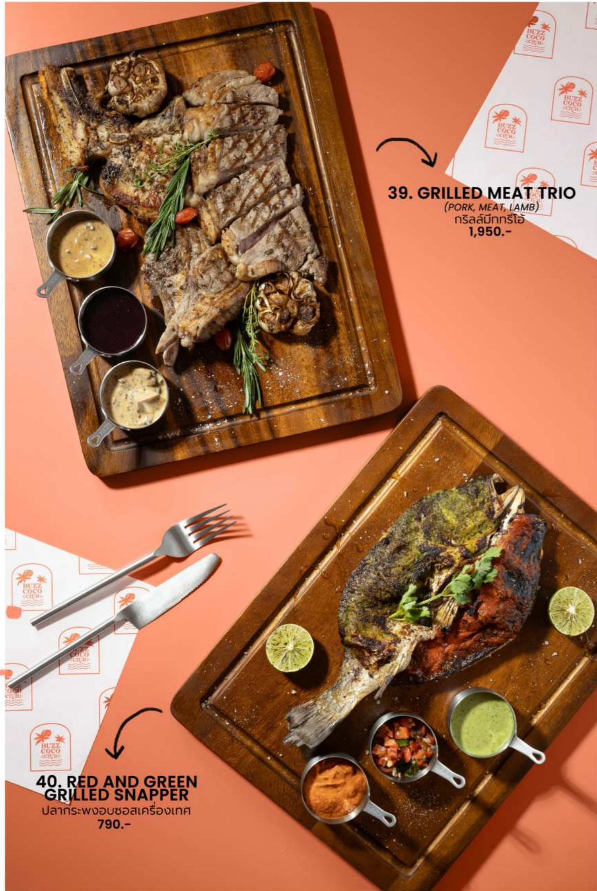
39. GRILLED MEAT TRIO (PORK, MEAT, LAMB) กริลล์มีททริโอ 1,950.-