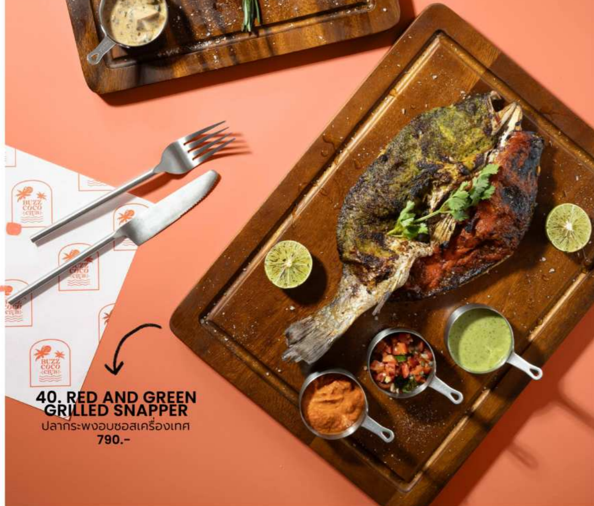
40. RED AND GREEN GRILLED SNAPPER ปลากระพงอบซอสเครื่องเทศ 790.-