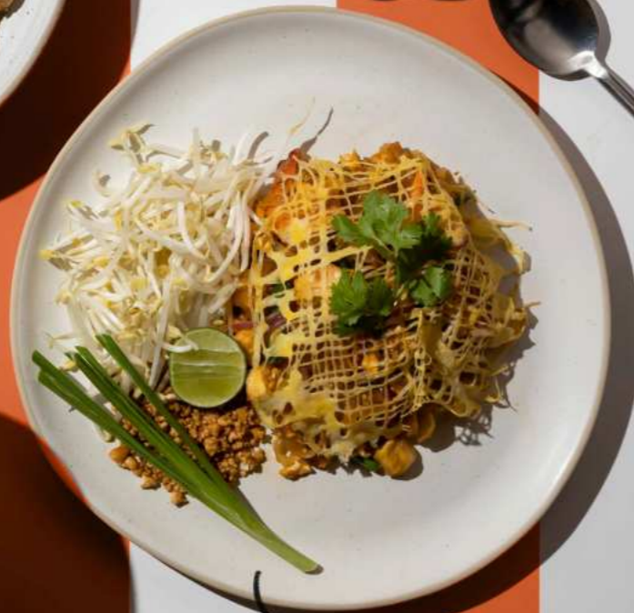
25. SHRIMP PAD THAI WRAPPED IN EGG ผัดไทยห่อไข่ 290.-