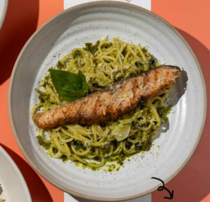
28. CREAMY PESTO SALMON PASTA พาสต้าซอลมอนเพสโต 460.-