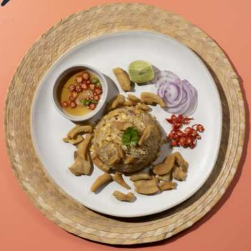
32 . FRIED RICE WITH PORK CRACKLING ข้าวผัดกากหมู 250.-