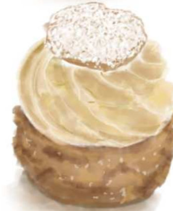
68. CHOUX CREAM ซูครีม 110.-