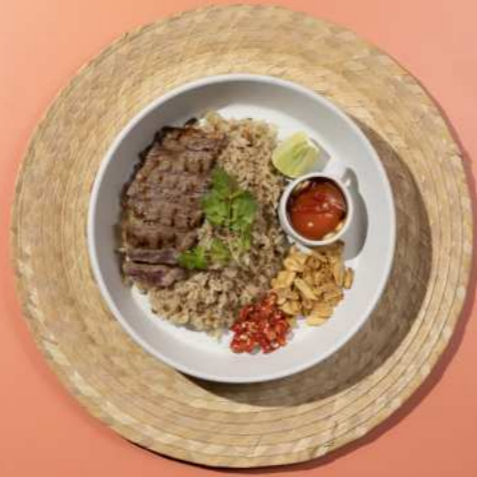
33 . FRIED RICE WITH STEAK AND MARINATED EGG YOLK ข้าวผัดมันเนื้อไข่ดอง 460.-