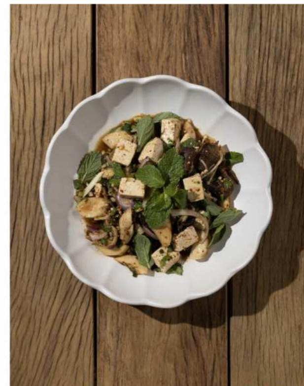
51. MUSHROOM AND TOFU LARB SALAD ลาบเห็ดและเต้าหู้ 220.-