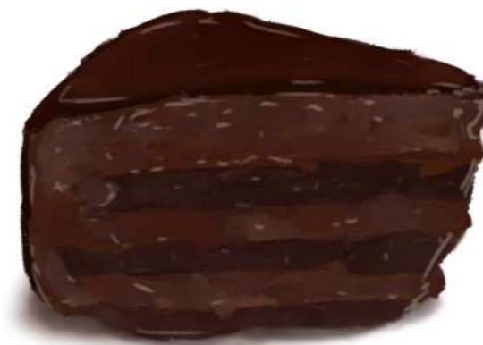
70. CHOCOLATE CAKE เค้กช็อกโกแลต 120.-