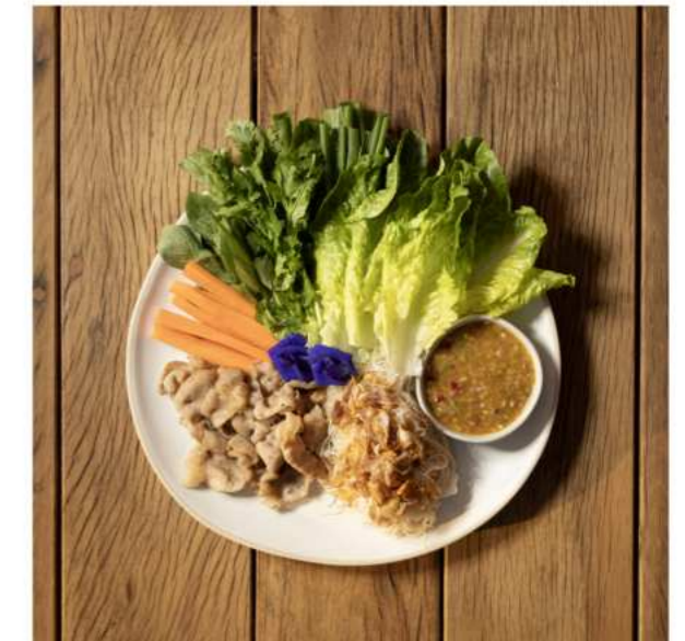
9. SPICY PORK SALAD WRAP เมี่ยงหมู 350.-