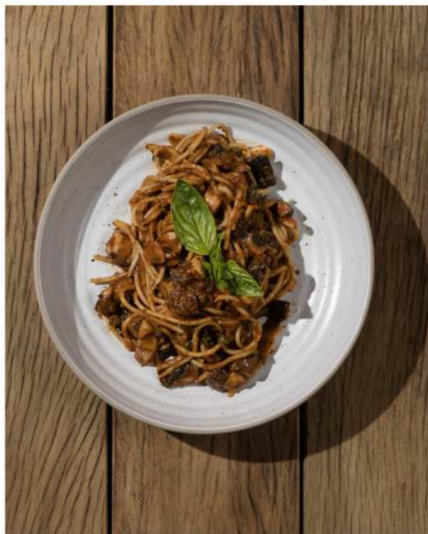
48. MUSHROOM RAGU PASTA พาสต้าซอสมะเขือเทศและเห็ด 290.-