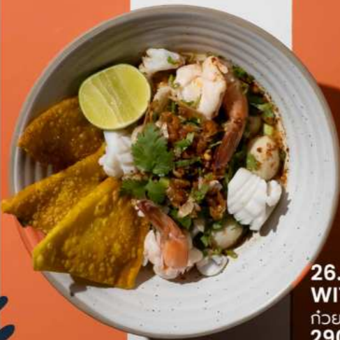
26. TOM YUM NOODLES WITH SEAFOOD ก๋วยเตี๋ยวดับยำทะเล 290.-