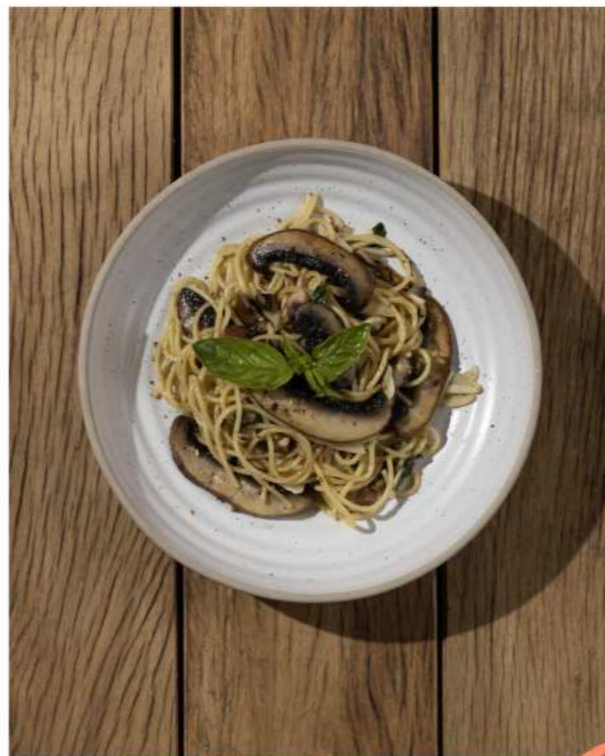
47. PORTOBELLO AGLIO E OLIO PASTA พาสต้าพอร์โทเบลโลผัดน้ำมันมะกอก 290.-