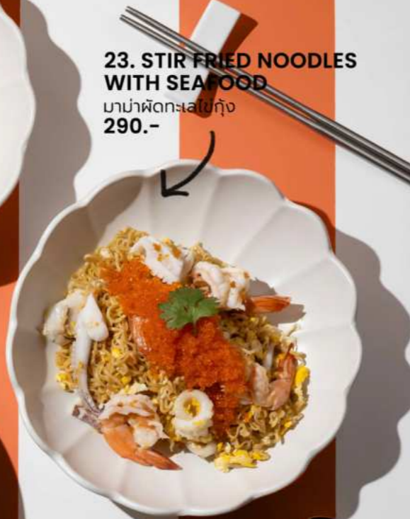
23. STIR FRIED NOODLES WITH SEAFOOD มาม่าผัดทะเลไข่กุ้ง 290.-