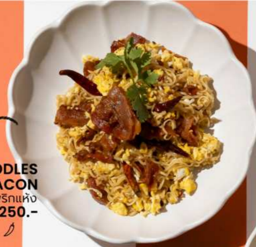
22. STIR FRIED NOODLES WITH BACON มาม่าผัดเนคอนพริกแห้ง 250.-