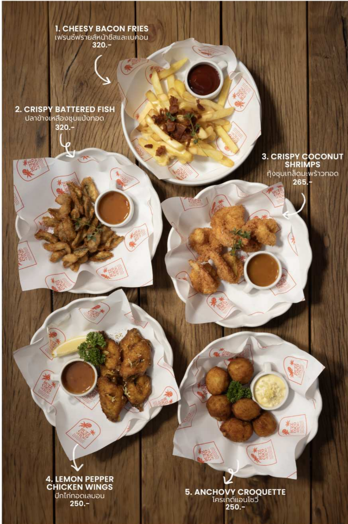
1. CHEESY BACON FRIES เฟรนช์ฟรายส์หน้าชีสและเบคอน 320.-