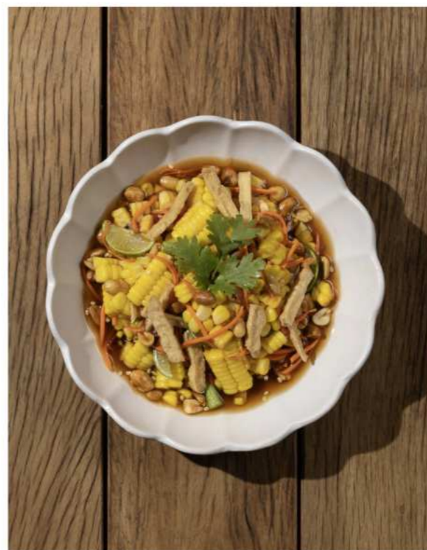
52. SOM TAM THAI WITH CORN ส้มตำไทยข้าวโพด 220.-