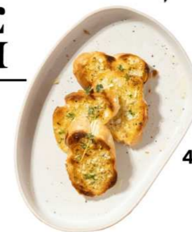
44. GARLIC BREAD ขนมปังกระเทียม 120.-