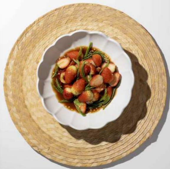
14. STRAWBERRY AND SHRIMP PASTE SALAD (SEASONAL) ตำสตรอว์เบอร์รี่ทะเล 320.-