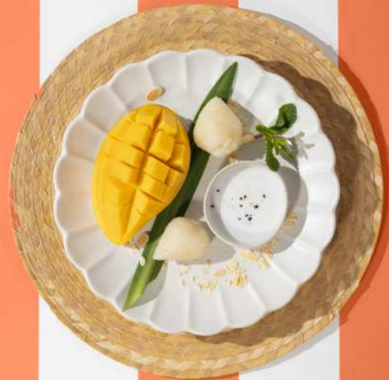
65. MANGO STICKY RICE ข้าวเหนียวมะม่วง 250.-