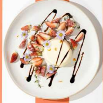
64. ORANGE PANNA COTTA WITH BALSAMIC GLAZE พานนาคอตต้าส้มเสิร์ฟพร้อมซอสบัลซามิก 260.-