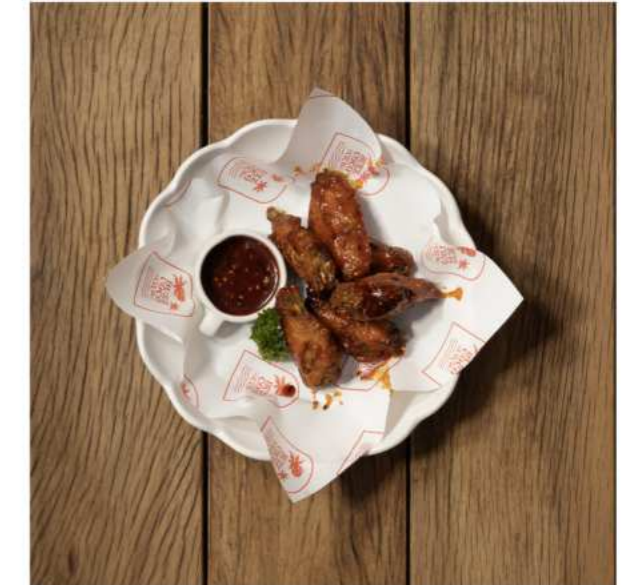
7. CHICKEN GOCHUJANG ไก่ทอดซอสโคชูจัง 250.-