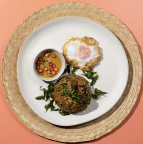
34. BASIL FRIED RICE WITH CRISPY FRIED EGG (CHICKEN/ PORK/ BEEF/ SEAFOOD) ข้าวผัดกะเพราลูกไข่ดาวกรอบ (ไก่/หมู/เนื้อ/ทะเล) 250.-/290.- ดัด