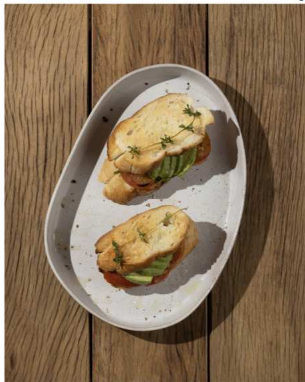
49. GRILLED TOMATO SANDWICH แซนด์วิชมะเขือเทศย่าง 290.-