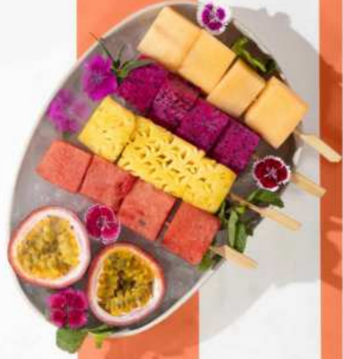
62. FRUIT PLATTER ON ICE (SEASONAL FRUITS) ผลไม้รวม 165.-