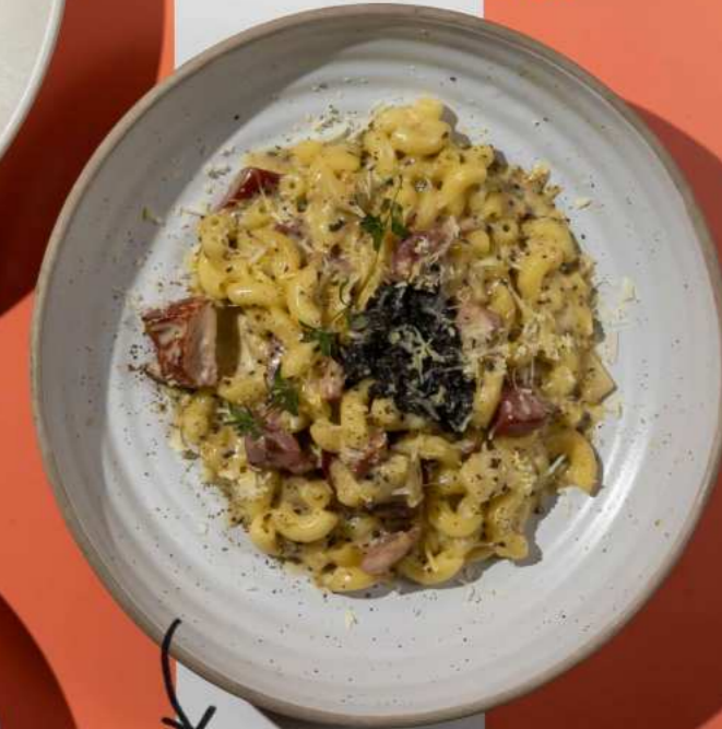
30. HAM MAC N CHEESE มัทกะโรน็อบแฮมชีส 350.-