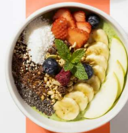
56. CLEAN & GREEN (KALE, GREEN APPLE, AND AVOCADO BASE) คลีนแอนด์กรีน 320.-