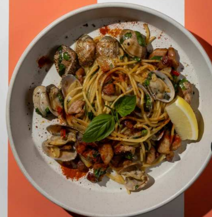
31. CLAMS AND BACON PASTA พาสต้าหอยลายและเบคอน 320.-

ราคานี้ไม่รวมค่าบริการ 10% และภาษีมูลค่าเพิ่ม 7% รูปภาพเพื่อการโฆษณาเท่านั้น หากท่านมีประวัติการแพ้อาหาร โปรดแจ้งพนักงานก่อนสั่งทุกครั้ง