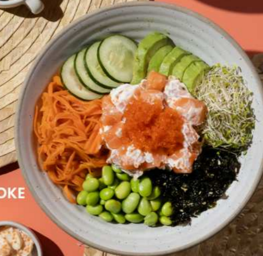
37. SALMON MAYO POKE โปเกะโบลล์แซลมอนมายโ 380.-