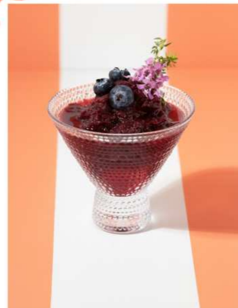
57. MIXED BERRY COCKTAIL GRANITA มิทซ์เบอร์รี่ค็อกเทลกรานิต้า 320.-