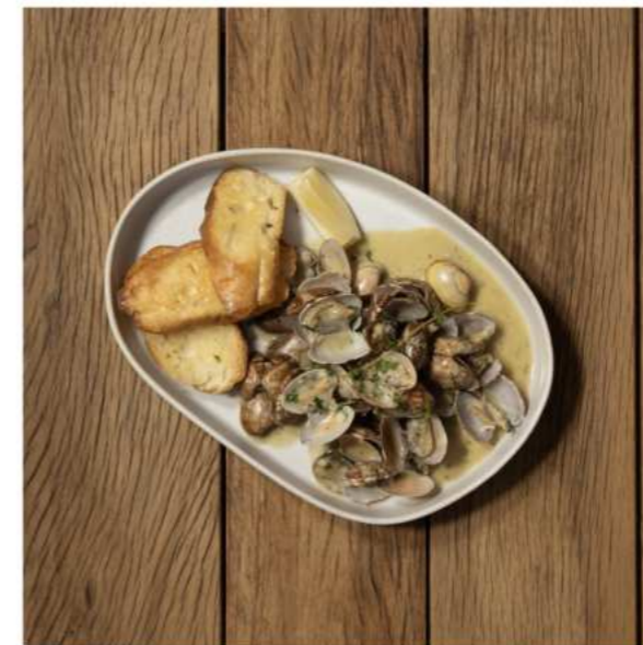
8. GARLIC BUTTER CLAMS WITH WHITE WINE หอยลายอบเนยกระเทียม และไวน์ขาว 320.-