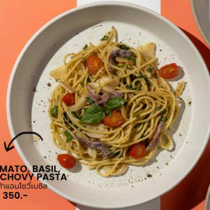
29. TOMATO, BASIL, AND ANCHOVY PASTA พาสต้าแอนโชวีเบซิล 350.-