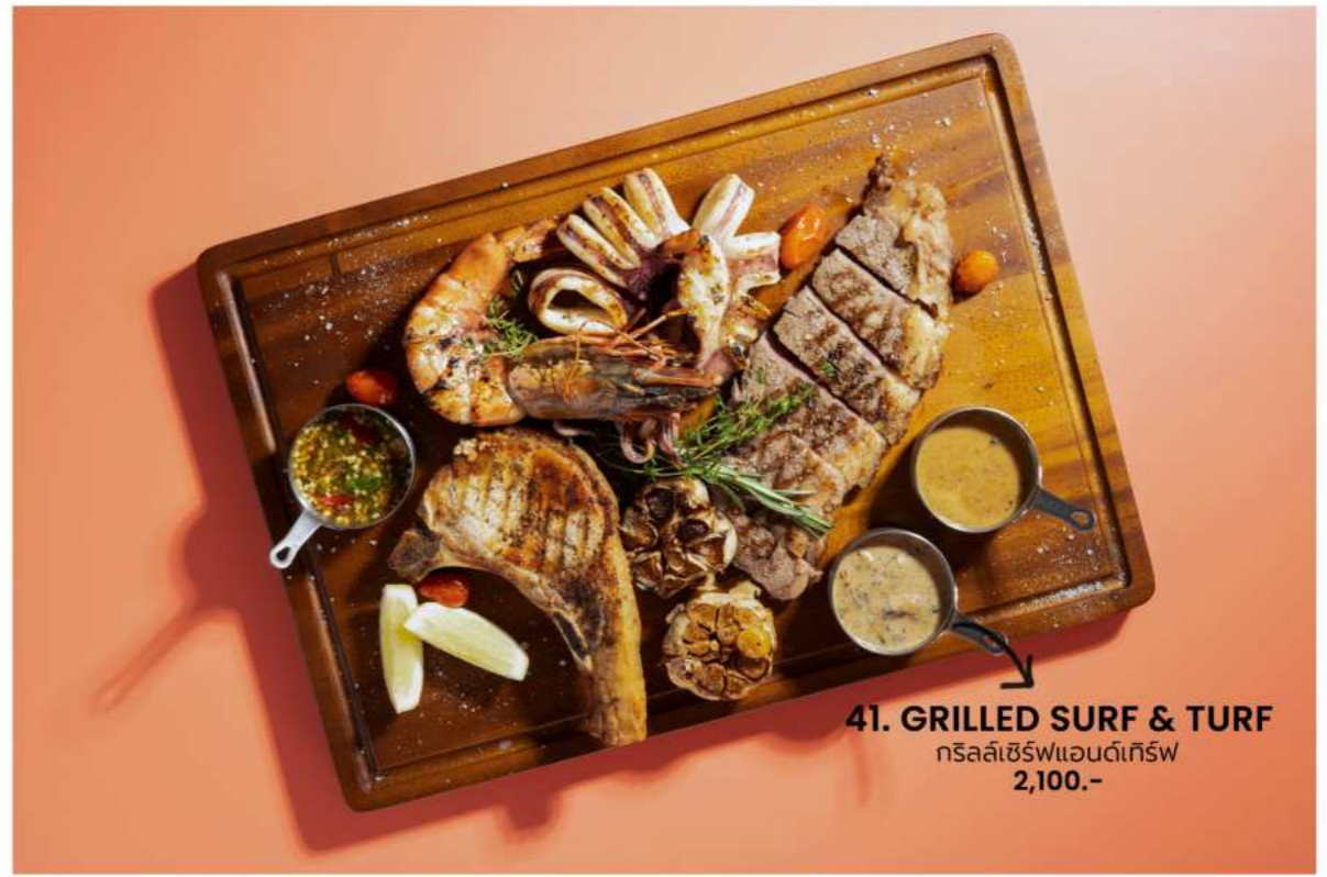
41. GRILLED SURF & TURF กริลล์เซิร์ฟแอนด์ทีร์ฟ 2,100.-