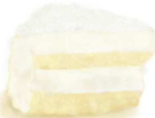
69. COCONUT CAKE เค้กมะพร้าว 120.-