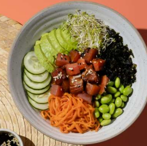
36. TUNA SHOYU POKE โปเกะโบลล์ทูน่าโชยุ 380.-