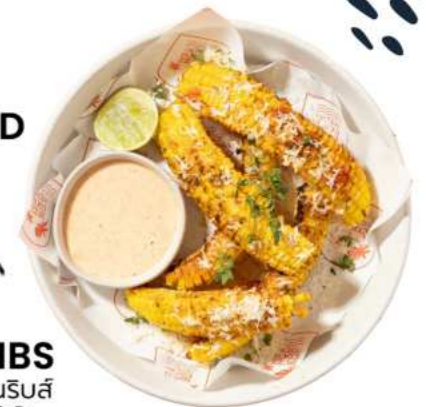
45. GRILLED CORN RIBS กริลล์คอร์นริบส์ 160.-

ราคาไม่รวมค่าบริการ 10% และภาษีมูลค่าเพิ่ม 7% รูปภาพเพื่อการโฆษณาเท่านั้น หากท่านมีประวัติการแพ้อาหาร โปรดแจ้งพนักงานก่อนสั่งทุกครั้ง