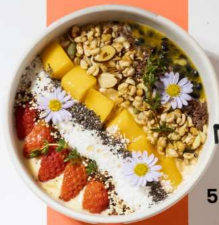
54. TROPICAL ALOHA (MANGO, PINEAPPLE, AND PASSION FRUIT BASE) ทรอปิคอล อโลฮา 280.-