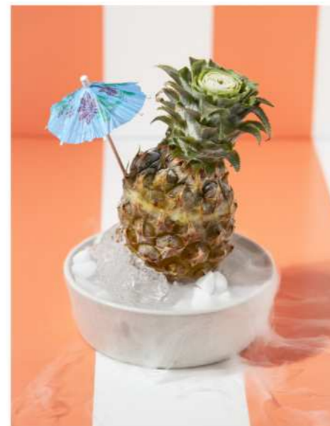
61. PINEAPPLE SORBET เชอร์เบตสับปะรด 160.-