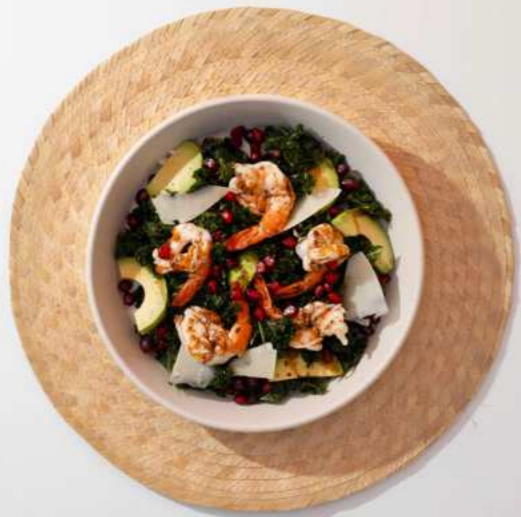
11. AVOCADO SHRIMP SALAD สลัดเคลอโวคาโตกุ้ง 450.-