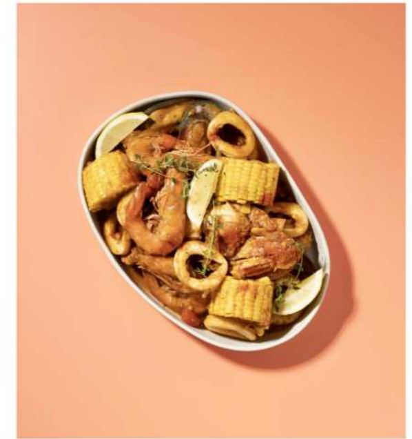
43. BANG BANG SEAFOOD BOIL ซีฟู้ดอบซอสแบงแบง 1,590.-