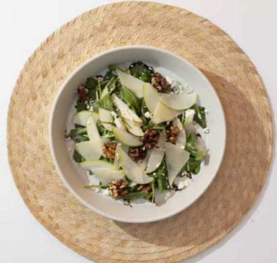
12. GREEN APPLE SALAD สลัดแอปเปิ้ล 320.-