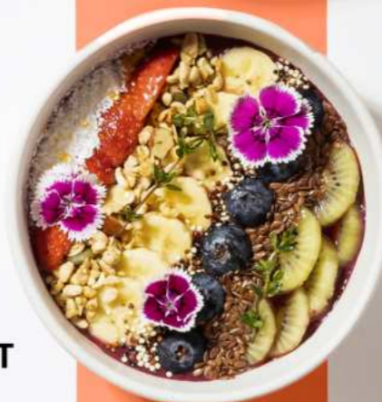
55. ACAI BERRY BLAST (ACAI AND BERRY BASE) อาซาอิเบอร์รี่บลาสต์ 320.-