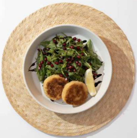
13. CRAB PANCAKE SALAD สลัดแพนเค้กปู 590.-