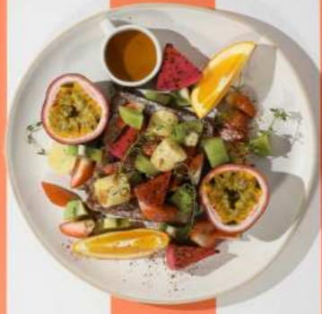
63. TROPICAL FRENCH TOAST ทอปปิ้งผลไม้รสหวาน 390.-