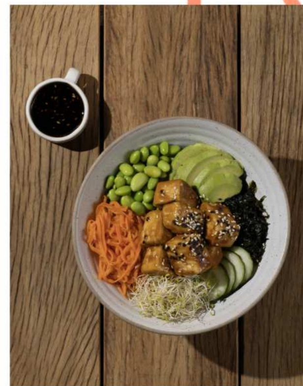
53. TOFU TERIYAKI POKE BOWL โปเกโบลว้หน้าเต้าหู้เทอริยากิ 300.-