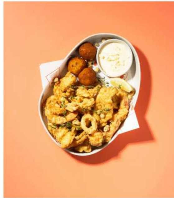
42. CRISPY SEAFOOD PLATTER คริสปี้ซีฟู้ดแพลตเตอร์ 550.-