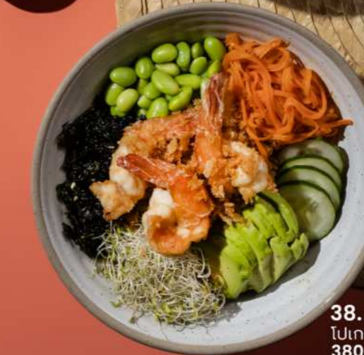
38. CRUNCHY PRAWN POKE โปเกะโบลล์กุ้งครันชี 380.-

ราคานี้ไม่รวมค่าบริการ 10% และภาษีมูลค่าเพิ่ม 7% รูปภาพเพื่อการโฆษณาเท่านั้น หากท่านมีประวัติการแพ้อาหาร โปรดแจ้งพนักงานก่อนสั่งทุกครั้ง