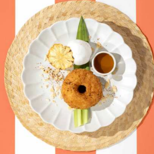
66. PINEAPPLE FRITTER WITH COCONUT ICE CREAM สับปะรดชุบเกล็ดมะพร้าวทอดเสิร์ฟพร้อมไอศกรีมกะทิ 260.-