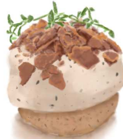
67. EARL GREY CAKE เค้กเอิร์ลเกรย์ 130.-