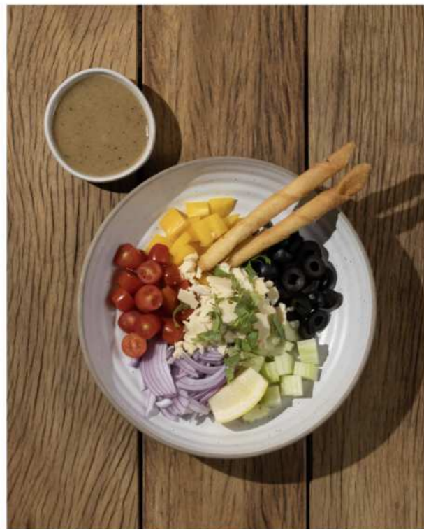
46. GREEK SALAD กรีกสลัด 360.-